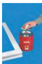
navlhčenie handry na čistenie