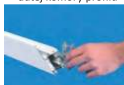
priloženie rohového uholníka