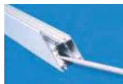
nanesenie lepidla do dutej komory profilu