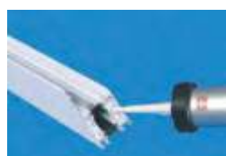
nanesenie lepidla do dutej komory profilu