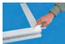
čistenie povrchu profilu