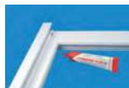
priloženie prídavného profilu