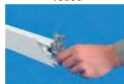
rovnomé navlhčenie lepiacich plôch