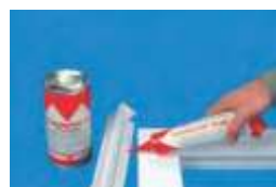
na prídavný profil