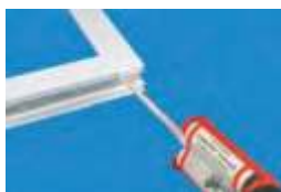
vstreknutie lepidla do komory profilu