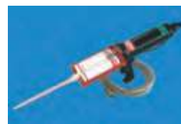
COSMOFEN dávkovacia pištoľ