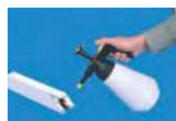
ostrekovanie lepidla vodou